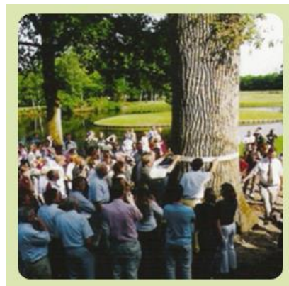
Eens per 5 jaar meet de familie de dikte van De Treeker Eik...